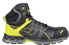
VELOCITY 2.0 YELLOW MID 633880