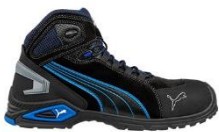
RIO BLACK MID 632250