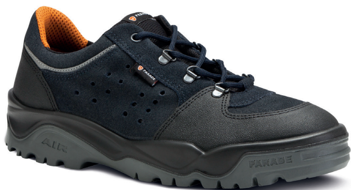
7822 MARINE | 39 ▶ 47