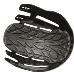
SCARAP2 : Coque semi pleine